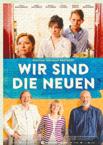
„WIR SIND DIE NEUEN“

27. APRIL 2019 | 15:30 UHR MODERNES THEATER WEINHEIM