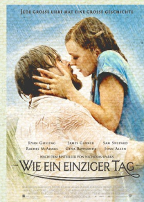
„WIE EIN EINZIGER TAG“

28. APRIL 2019 | 18:00 UHR BRENNESSEL HEMSBACH