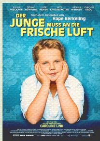
„DER JUNGE MUSS AN DIE FRISCHE LUFT“

26. APRIL 2019 | 20:00 UHR MODERNES THEATER WEINHEIM