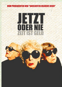
„JETZT ODER NIE“

26. APRIL 2019 | 20:00 UHR MODERNES THEATER WEINHEIM